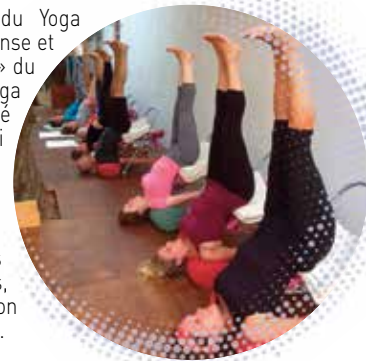
Exemple de posture utilisant du matériel

Courrier : YOGARAMA chez Chantal BOYER, chemin du lac, 04160 Château-Arnoux