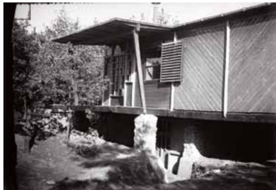
Maison du N°3 rue de la Colline en 1942