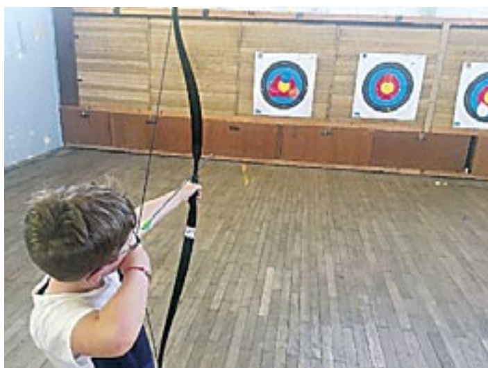
Initiation au tir à l'arc tous les vendredis.