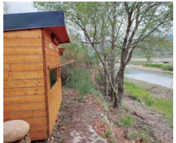
Nouveau poste d'observation du Prieuré à Château-Arnoux. Pensez à porter vos jumelles

De plus en plus face à ces problèmes qui nous dépassent, nous nous sentons désarmés, impuissants et l'éco-anxiété nous guette. Un remède tout simple est à notre portée : reconnectons-nous de façon désintéressée à la nature, devenons des militants de la vie ... et pourquoi pas en adhérant à la Cistude et en apportant votre pierre à la création de la Réserve Ornithologique de Haute Provence.