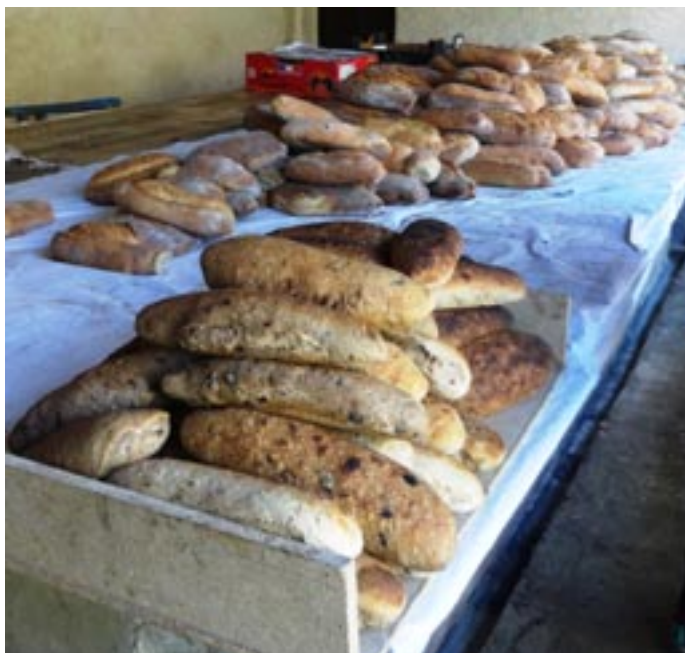
à la sortie du four

Le four citoyen, mis en chauffe dès le début de la semaine, a assuré la cuisson de 1300 pains, plus d'innombrables plaques de fougasses et pizza, qui n'ont hélas pas réussi à satisfaire l'ensemble de tous les amateurs de belle boulange au feu de bois.