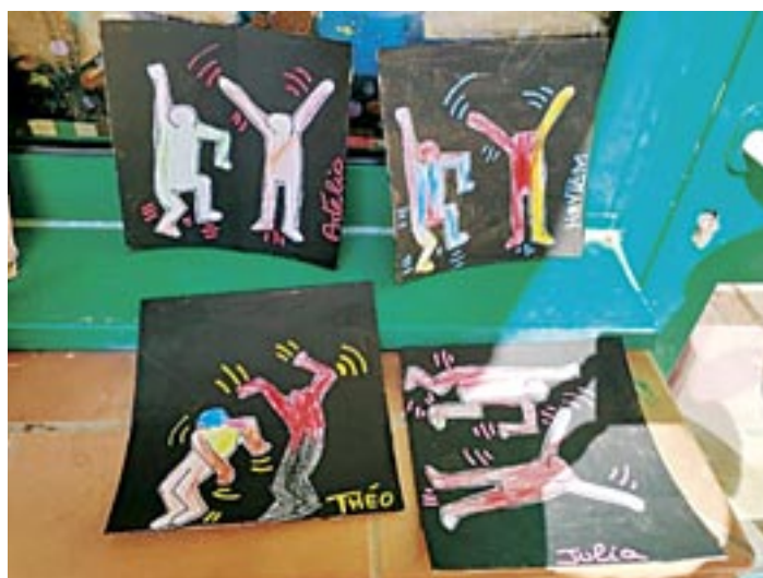
Activité Street Art réalisée par les 3-5 ans